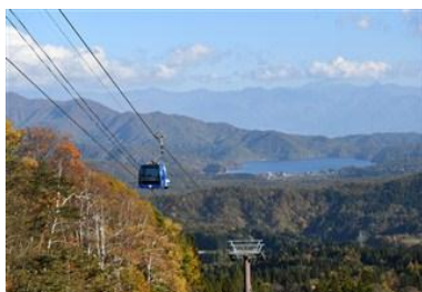
野尻湖と北信濃の山々