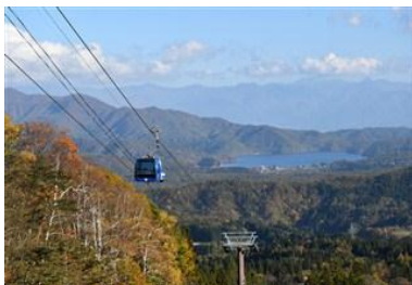
野尻湖と北信濃の山々

※幼児はおとな1名の同行につき1名さままで無料となります。(1名を超える場合は子ども料金を適応)